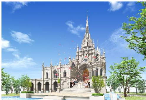
アートグレース大聖堂

青空にそびえる本格ゴシック様式の大聖堂はニューヨークのセントパトリック教会をモチーフとしたチャペル。精巧な装飾が施された室内には、ウェディングに慣れたゲストも思わず息をのむ、荘厳な雰囲気が漂います。 教会式、人前式対応可（120名収容）