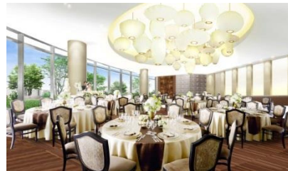
ルーフトップガーデン [ホテル棟] （正餐 120名・立食 160名）