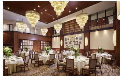
オークルーム（正餐 70名・立食 130名）