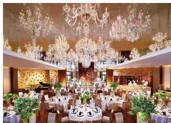
グランコート（正餐 200名・立食 280名）

木や石といった自然素材に包まれた、あたたかみのあるチャペル。祭壇の奥に広がるガーデンからは明るくやさしい光が差し込み、神聖でありながらどこか心地よいおふたりらしい感謝の想いが伝わるセレモニーが叶います。 教会式、人前式対応可（90名収容）