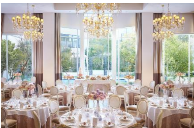
シャトー・シャンパーニュ（正餐 190名・立食 300名）