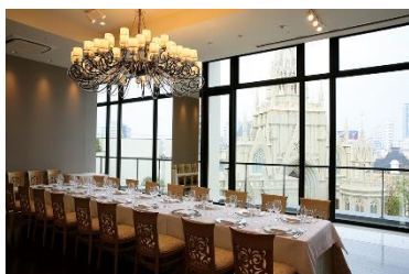
スカイビュールーム [ホテル棟] （正餐 35名・立食 55名）

国内外の人気ブランドを揃えたウェディングドレスサロン「DESTINY Line（デスティニーライン）」とNY発・世界最高峰のウェディングドレスブランド「VERA WANG BRIDE（ヴェラ・ウォン ブライド）」を導入し名古屋エリア最大のブランドラインナップを誇る衣装を提供。多様化するニーズを叶えた最高の結婚式をプロデュースいたします。