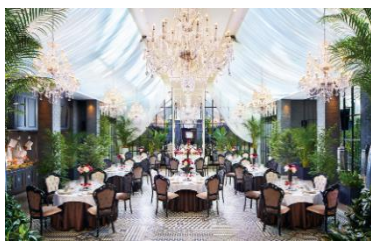
グラスハウス（正餐 88名・立食 150名）