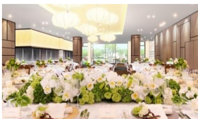
フローティングテラス [ホテル棟] （正餐 120名・立食 160名）